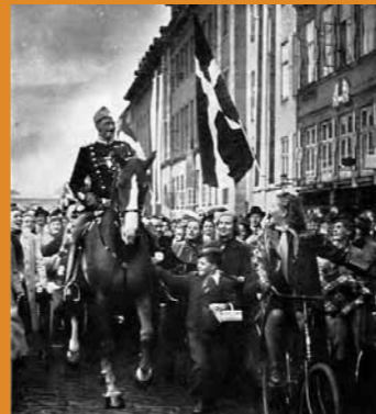
König Christian von Dänemark reitet in schweigendem Protest gegen die deutsche Besatzung durch Kopenhagen (1940)

wurde 1941 von der Wehrmacht besetzt und musste 8 Torpedoboote an die deutsche Reichsmarine abliefern. Vor der Auslieferung wurden aber Geschütze, Torpedowerfer und Navigationsgeräte ausgebaut und versteckt. Die Schiffe waren für die Reichsmarine unbrauchbar. (5) Die dänische Regierung lehnte jede antijüdische Gesetzgebung ab. 1943 wurde die Evakuierung der dänischen Juden nach Schweden organisiert. (6)